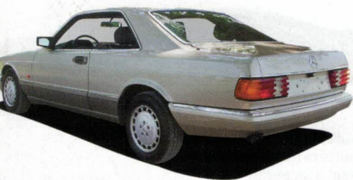
7 Topmodellen i Mercedes' modelprogram i 80'erne hed 560 SEC. Den kostede 1,6 mio. kr. fra ny. Sådant én bil vil blive umulig at importere i fremtiden

Audi's quattro-modeller var dyre fra ny, og det vil i fremtiden få afgiften til at stige, så det bliver mindre interessant at importere dem ↙